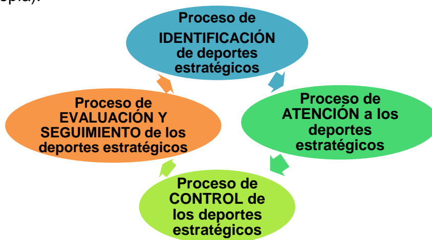
Figura 1. Suprasistema Proceso de gestión de los deportes estratégicos

El proceso de identificación de deportes estratégicos constituye un SISTEMA embebido en un SUPRASISTEMA (el Proceso de gestión de los deportes estratégicos), con cuyos demás sistemas se interrelaciona (figura 1); así por ejemplo, la Salida de este sistema (Proceso de identificación de deportes estratégicos), en forma de información, es empleada en la toma de decisiones relativas al Proceso de atención a los deportes estratégicos; de igual forma, la Salida de tal sistema (devenida a su vez en outcome o impacto del suprasistema) aporta información que retroalimenta el sistema Proceso de identificación de deportes estratégicos (Neguentropía).