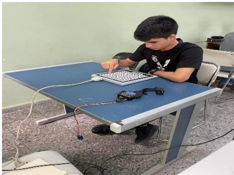
Fig. 1. - Desempeño de un participante durante realización de la tarea de la tabla rojinegra de Shulte Platonov en el Centro de Estudio de ajedrez – ISLA

Estación 1: prueba de la tabla rojinegra de Shulte-Platonov (TRNS-P). Permite la determinación de la concentración, la estabilidad y la alternancia de la atención mediante el método Schulte-Platonov (Figura 1).